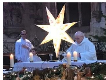
Veillée et Messe de la Nuit de Noël à l'église St Seine de Corbigny