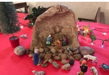
Exposition de crèches à l'église de Chevannes-Changy