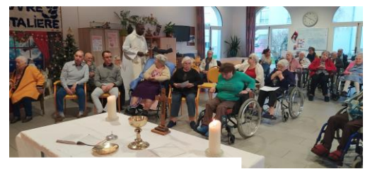
Messe de Noël à l'œuvre hospitalière à Corbigny