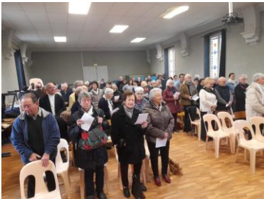
Recollection de l'Avent à St Leonard le 1 er Décembre