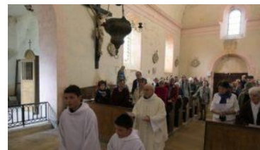
St Germain des Bois le 6 août