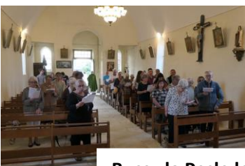
Bussy la Pesle le 12 août