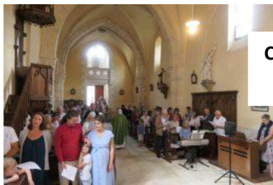
Champallemont le 16 juillet