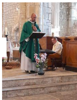
Cervon le 27 août