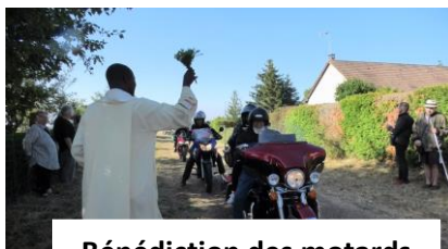
Bénédiction des motards à Tannay le 2 juillet