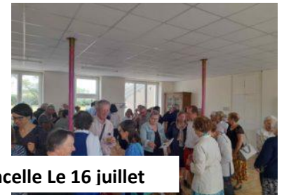
La Colancelle Le 16 juillet