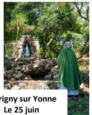
Marigny sur Yonne Le 25 juin