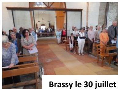
Brassy le 30 juillet