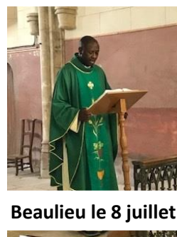
Beaulieu le 8 juillet