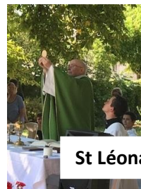
St Léonard le 20 août