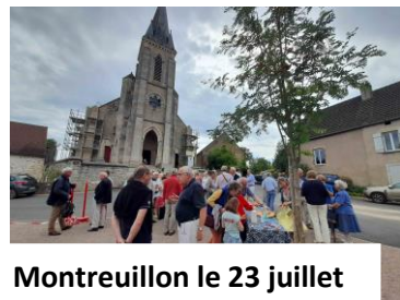
Montreuillon le 23 juillet