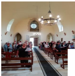
Neully le 29 juillet