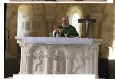
Authiou le 27 août