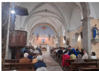
St Martin du Puy le 5 août