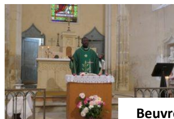
Beuvron le 23 juillet