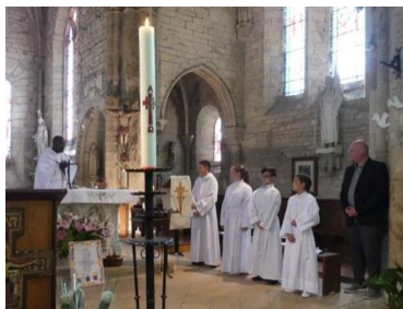
Eglise de Tannay Profession de foi Dimanche 4 juin