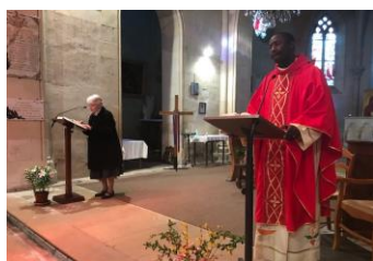
Photos de la célébration à l'église de Brinon