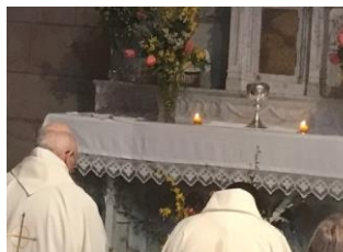
Transfert du St Sacrement