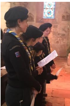
Le dimanche 15 janvier à Brinon

Pour des situations de santé différentes, le recours à ce Sacrement peut être demandé plusieurs fois : la grâce du Seigneur est inépuisable pour continuer à le louer sur la terre des vivants. (Is. 38,19 a) Patrick