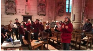
Temps de Louange Eglise de Corbigny