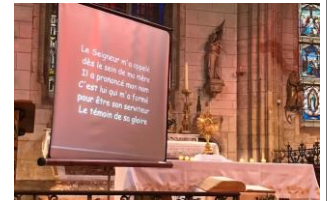
Dimanche 22 janvier