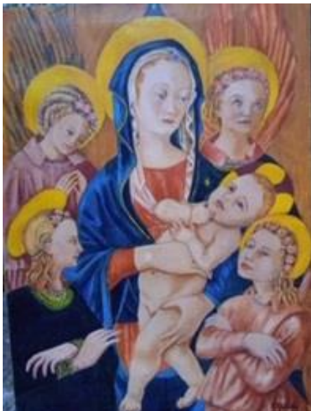
Vierge à l'enfant entourée d'anges

les mercredis 6, 13 et 20 octobre à 10h00 au presbytère Samedi 23 octobre : Journée Comme un arbre à St Léonard