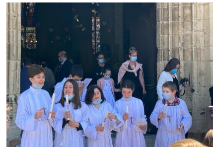
Profession de Foi le dimanche 30 mai à l'église de Corbigny