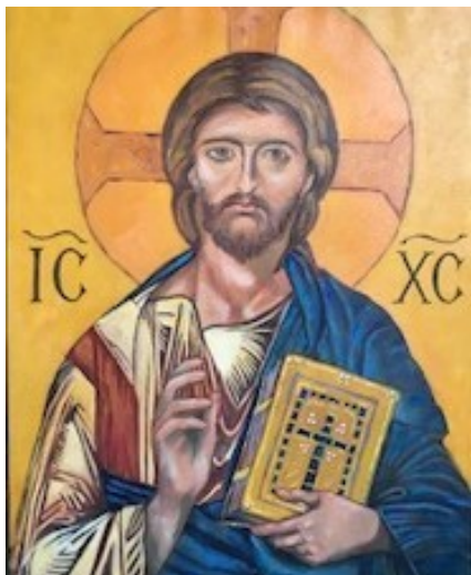
Le Christ PANTOCRATOR

1 2,Tm 2,12 2 Relire l'édito de juin 2021