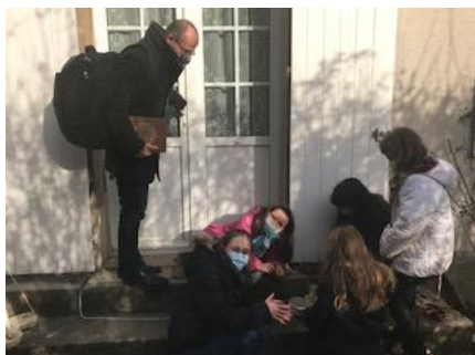
Plantation des graines de la croix fleurie

Avec les enfants du Caté, un après-midi "Comme un arbre" planté au bord du ruisseau, il donne beaucoup de fruit (psaume 1) Réunis dans l'église pour chanter "Mets ta joie dans le Seigneur" puis lecture du livre de Daniel (Dn3, 57-82) en reprenant avec entrain le refrain : "Bénissez le Seigneur", vous les anges, vous les cieus... bénissez le Seigneur... suivi d'un temps de bricolage. Nous avons ensuite regardé une vidéo "Laudato Si" sur la lettre du pape François, pour les jeunes, et ensuite un partage sur ce sujet. Nous terminons par l'Eucharistie après avoir confectionné pour chacun une croix constituée de petits pots en tourbe remplis de terre, semés de cinq graines à arroser durant tout le carême. Bel après-midi !